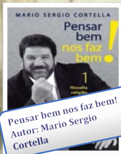
Pensar bem nos faz bem! Autor: Mario Sergio Cortella