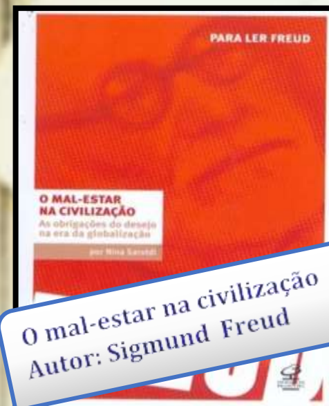
O mal-estar na civilização Autor: Sigmund Freud