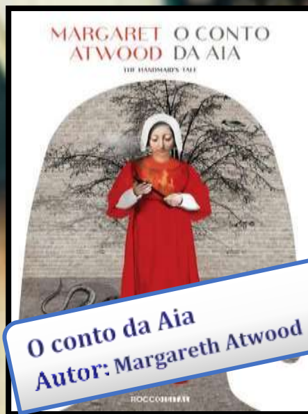
O conto da Aia Autor: Margareth Atwood