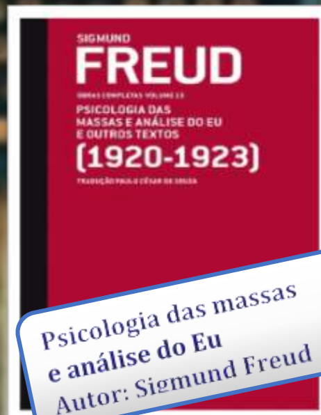
Psicologia das massas e análise do Eu Autor: Sigmund Freud