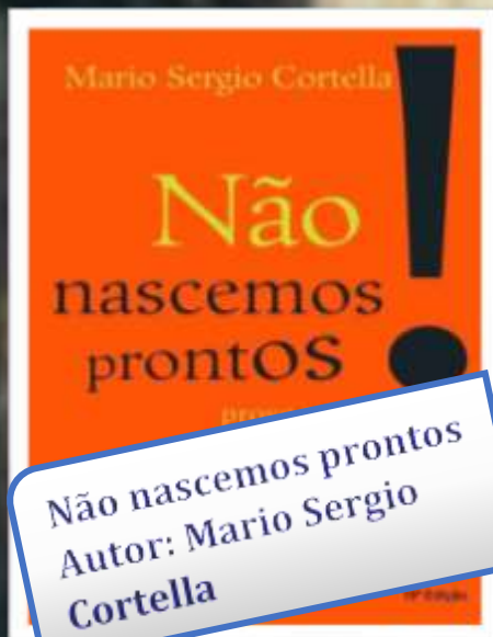
Não nascemos prontos Autor: Mario Sergio Cortella