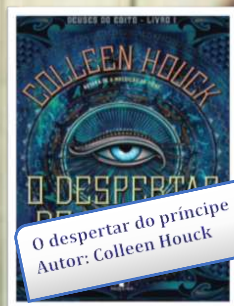
O despertar do príncipe Autor: Colleen Houck