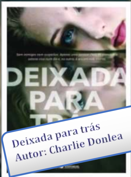
Deixada para trás Autor: Charlie Donlea